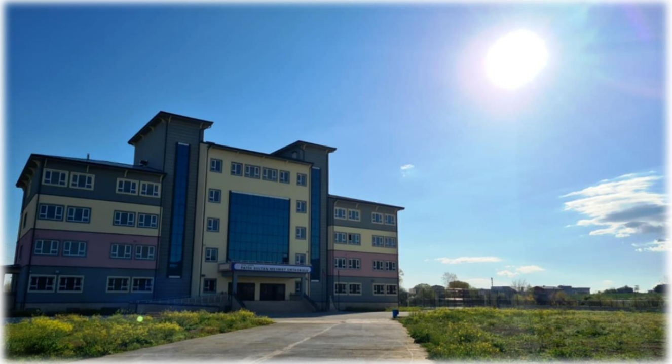
Resim 1. Okulumuz Binası

Okulumuz, 17 Ağustos 1999'da meydana gelen büyük depremten sonra, 2000-2001 eğitim öğretim yılında, 17 Ağustos İlköğretim Okulu adıyla dokuz derslikli prefabrik bir yapıda hizmete açılmış, daha sonra Dünya Bankası tarafından üç katlı inşa edilen yeni binasında, 2003-2004 eğitim öğretim yılından itibaren hizmete devam etmiştir. 4+4+4 eğitim sistemiyle 17 Ağustos İlkokulu ve Ortaokulu olarak aynı binada eğitim öğretimi sürdürmüş, 2021 yılında mevcut yeni okul binamıza taşınarak okulumuzun adı Fatih Sultan Mehmet Ortaokulu olarak değiştirilmiştir. Fiziki olarak eğitim- öğretim yönünden her türlü ihtiyaca cevap verecek şekilde inşa edilen mevcut okulumuz binası, modern bir eğitim ve yaşam alanı olarak tasarlanmıştır.