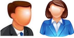
Özel Eğitim Öğretmenleri